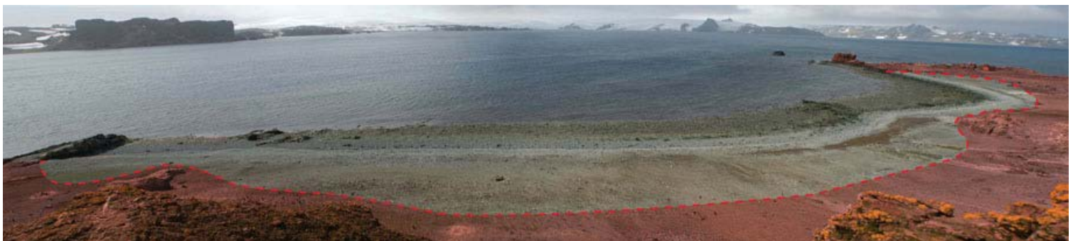
Vista del sitio desde el cerro Faro. El ingreso a la ZAEP 150 (en rojo) está prohibido, salvo que se cuente con un permiso.