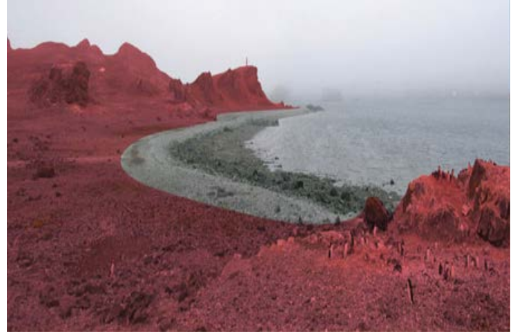
Vista del sitio desde punta Braillard, extremo oriental de la playa Noreste de península Ardley (isla Ardley). El ingreso a la ZAEF 150 (en rojo) está prohibido, salvo que se cuente con un permiso.