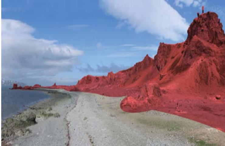
Vista del sitio desde la punta Faro, lugar de desembarque a la playa Noreste de península Ardley (isla Ardley). El ingreso a la ZAEF 150 (en rojo) está prohibido, salvo que se cuente con un permiso.